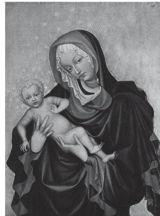
Madona Svatovítská – obraz věnovaný Janem z Jenštejna

Nyní se mistr Jan Hus v nebeském jasu nestvořené Trojice přičiňuje, aby jeho milovaní Čechové v posledních dnech znovu vstoupili do lůna svaté církve obecné. Do té církve Kristovy, kterou neznají všichni ti, kdo se v Lateránu „shodli“, že Jan Hus nepatří do žádné církve. V žádné ho totiž nechtějí, neboť v žádné – z těch zastoupených v Lateránu – nevěří tak, jak věřil on, tak jak věřili všichni svatí mučedníci a apoštolové Pána Ježíše Krista. Tato církev je skutečně a viditelně přítomna už zde na zemi ve všech svých