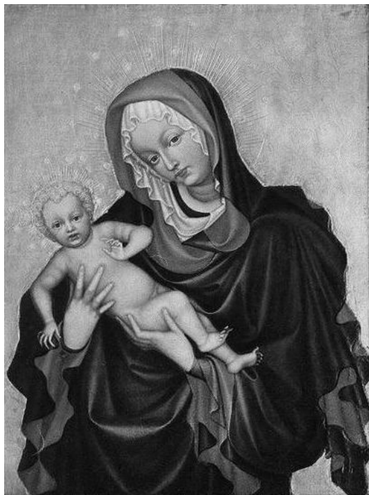
Madona Svatovítská – obraz věnovaný Janem z Jenštejna