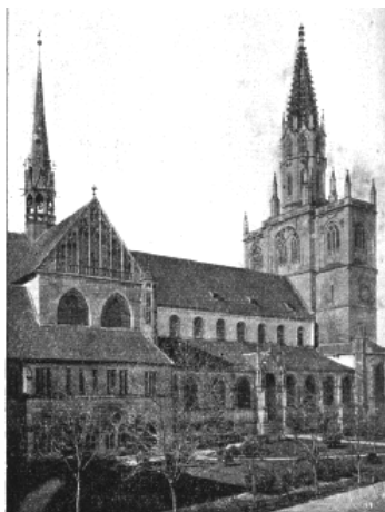
Kostnická katedrála – místo Husova odsouzení

Dne pak následujícího, který byl šestý den července, jinak v sobotu po Prokopovi, v oktávě svatých apoštolů Petra a Pavla, byl asi okolo šesté hodiny ranní mistr Jan Hus vyveden ze žaláře. Jeho lůžko bylo hned spáleno a popel hozen do Rýna. Na sobě měl Hus plášť a černé mistrovské roucho, na pravé noze měl pouto. 149 Arcibiskupem řížským byl přiveden k většímu chrámu města Kostnice; kde se konalo obecné zasedání prelátů za předsednictví římského a uherského krále. Přivedli ho ke dveřím kostela a čekali s ním v předsíni, dokud v kostele neskončila mše. Nechtěli ho vést do kostela při mši, snad aby se jím neposkvřili.